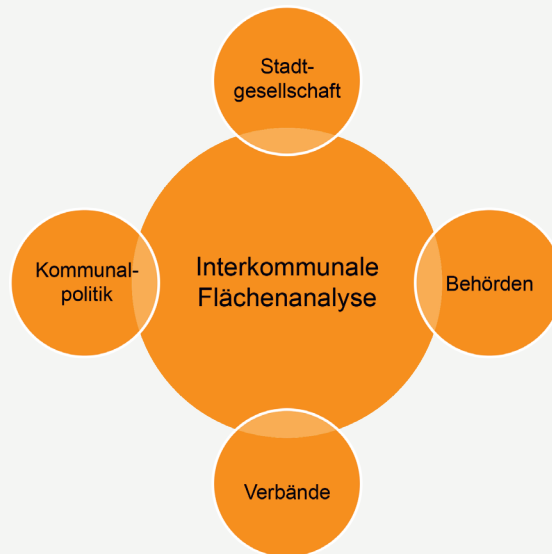
Schaubild der Beteiligten des Flächenanalyseprozesses

Darstellung der Beteiligten, die im Rahmen des Analyseprozesses Abschlussskriterien definieren können und gemeinsam den Abwägungsprozess ausgestalten.